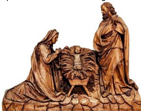
Holzrelief in St. Joseph, Ohligs

im Sinne der Nachhaltigkeit haben wir uns in diesem Jahr entschieden, auf die Versendung der Weihnachtspost zu verzichten. Da wir leider nicht alle Engagierten per Email erreichen, betrachten Sie bitte die nachstehenden Zeilen als Ihren persönlichen Weihnachtsgruß.