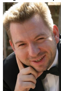
Jörg Nitschke Orgel